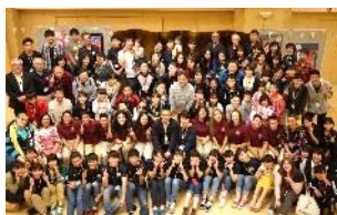
芽室町トレーシー市交流協会