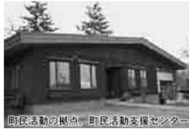
町民活動の拠点、町民活動支援センター