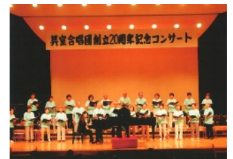
芽室合唱団創立20周年 記念コンサート