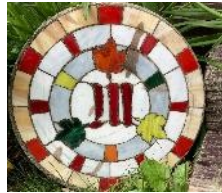
ステンドグラスメイプル