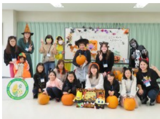
ALTエミリーさんと ハロウィンイベント