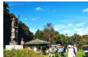
めむろ歴史探訪会