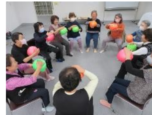
ガンバルーン体操ゲーム インストラクター講習会