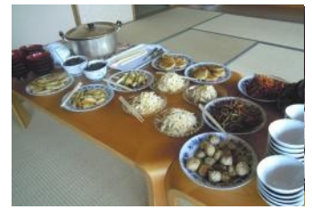
「心と身体と歯に やさしい食事」試食会