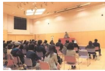
カラフルスマイルフェア (落語・講演会等)