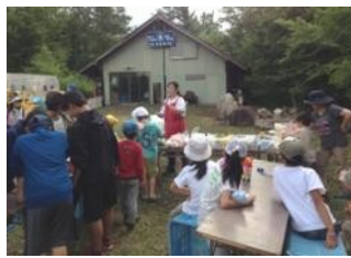
大自然のなかでの 創作キャンプ