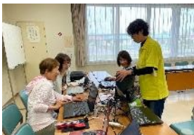
パソコンサークルたんぼぼ