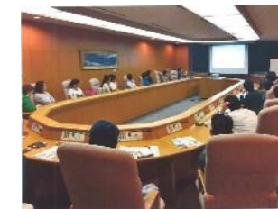
とかち農泊観光 シンポジウム