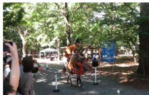
十勝どさんこ弓馬会