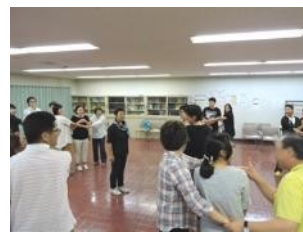
小学生のための劇遊び ワークショップ