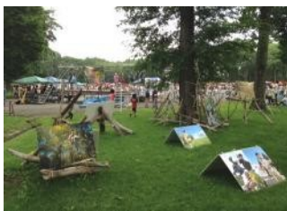
いのちのまつりINとかち (新嵐山会場)