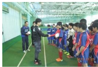
コンサドーレ札幌 サッカー教室