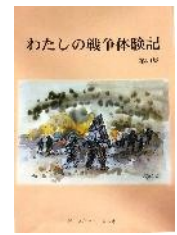
戦争体験記 冊子発行