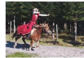
ホースバックアーチェリー 国際大会JAPAN